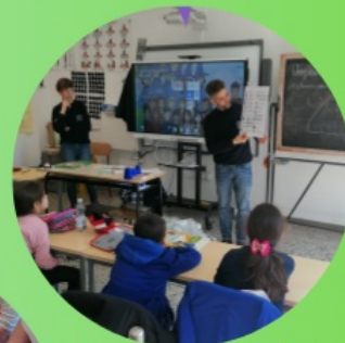
LEZIONI IN CLASSE